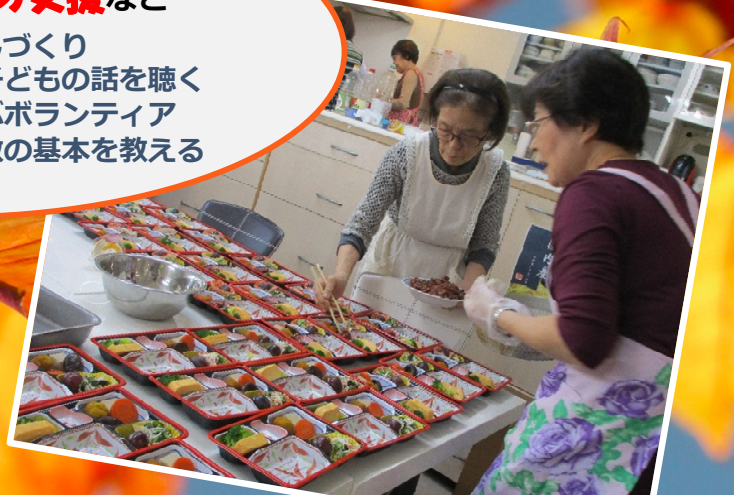
裏面にボランティア募集情報あり